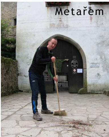
Metařem na hradě

Nová disciplína orientačního běhu je na obzoru. Průkopníci konverzačního orientačního běhu (KOB) AŠ, MŠ a MK představili účastníkům tábora tuto novinku. Hodnotícími kritérii jsou zejména náročnost tématu konverzace a nekompletnost pomůcek (mezi základní techniky patří trhání mapy či ztrácení startovního průkazu). Minimální čas strávený v lese je stanoven na 90 minut, což pro dané borce není sebemenší problém.